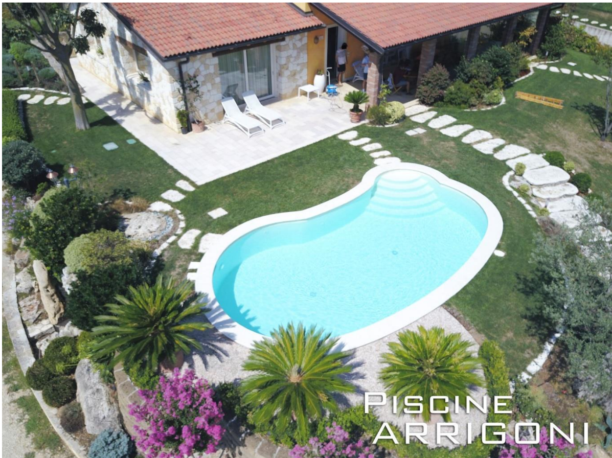
Piscina realizzata nei pressi Alghero (Sassari)