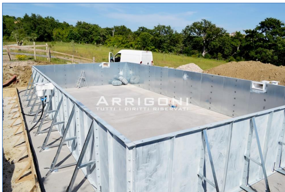
Piscina realizzata nei pressi di Manciano (Grosseto)