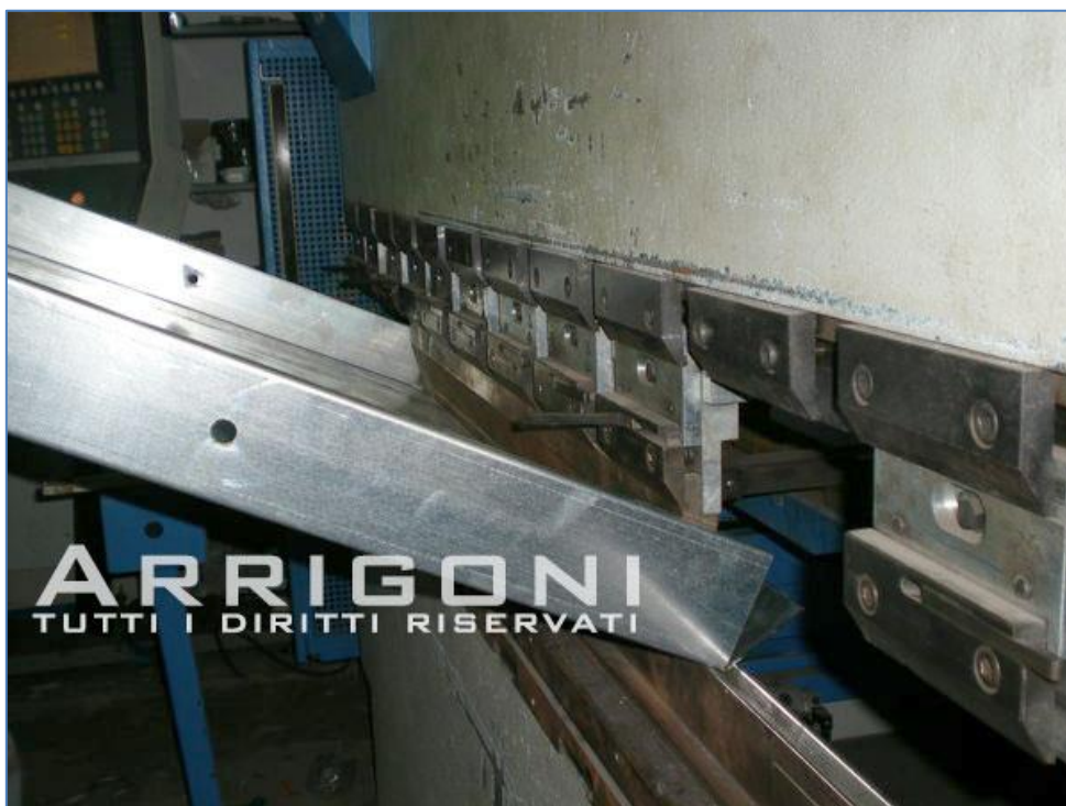
Produzione propria pannellatura