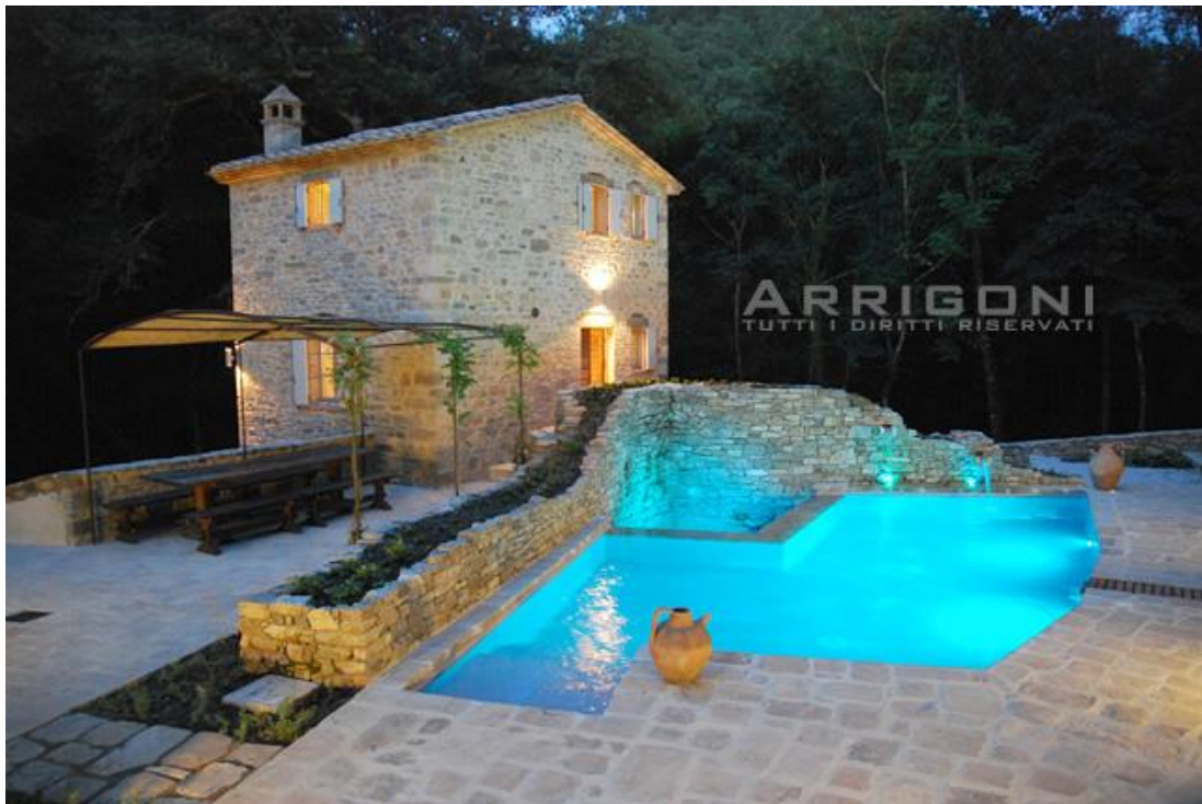
Piscina realizzata in Toscana nei pressi Grosseto illuminata con fari a led

Si tratta di fari a led a norma. I fari sono alimentati da apposito alimentatore e conformi per l'uso in piscina.