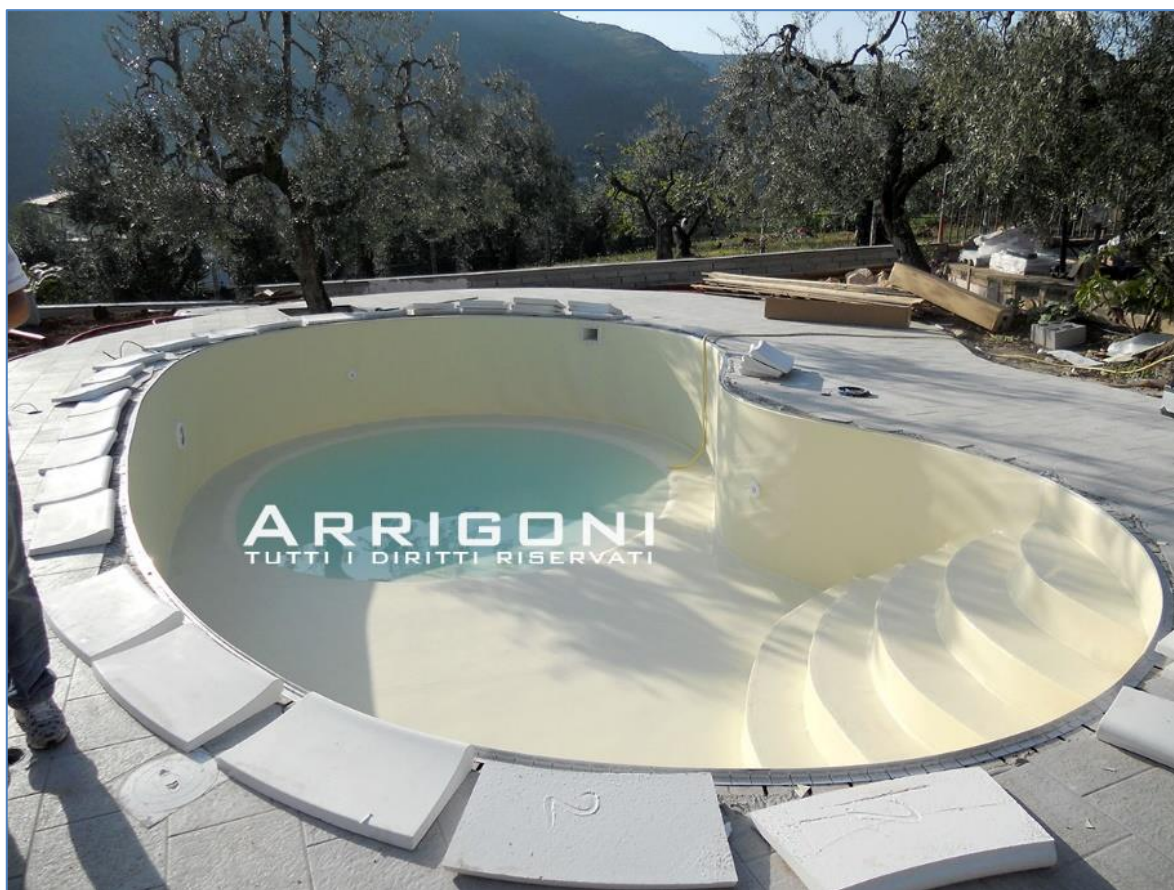
Foto scattata durante la posa della membrana in PVC su piscina costruita nei pressi di Rieti

Il rivestimento è in membrana di PVC da 1,5 mm con armatura interna di rinforzo garanzia 10 anni dal produttore . Produzione TEDESCA .