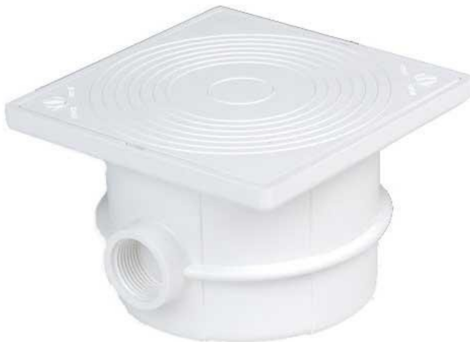
Scatola derivazione / sicurezza fari piscina

Il fissaggio della scatola di derivazione, verrà eseguito ad opera dei piastrellisti, durante al posa del rivestimento finale del marciapiede.