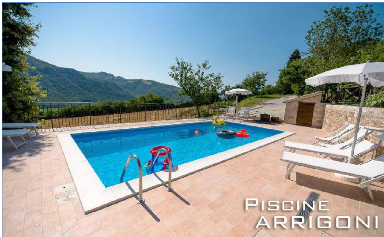
Piscina realizzata nei pressi di Cagli (Pesaro)