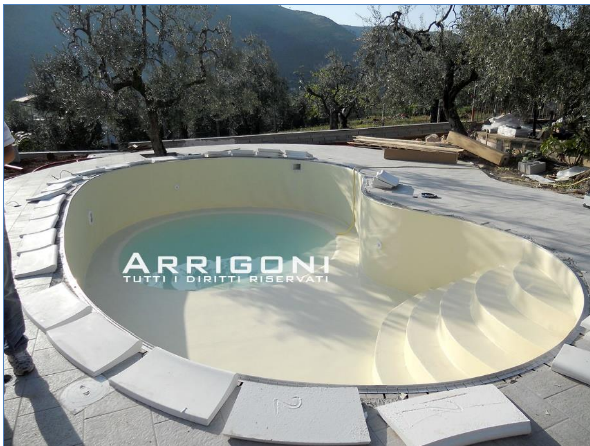
Foto scattata durante la posa della membrana in PVC su piscina costruita nei pressi di Rieti

Il rivestimento è in membrana di PVC da 1,5 mm con armatura interna di rinforzo garanzia 10 anni dal produttore . Produzione TEDESCA .