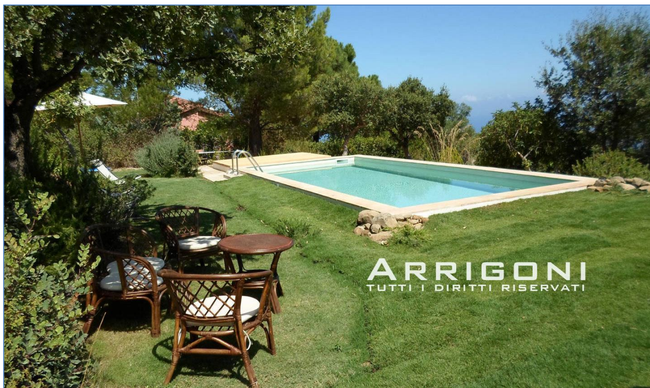
Piscina realizzata nei pressi di Cefalù